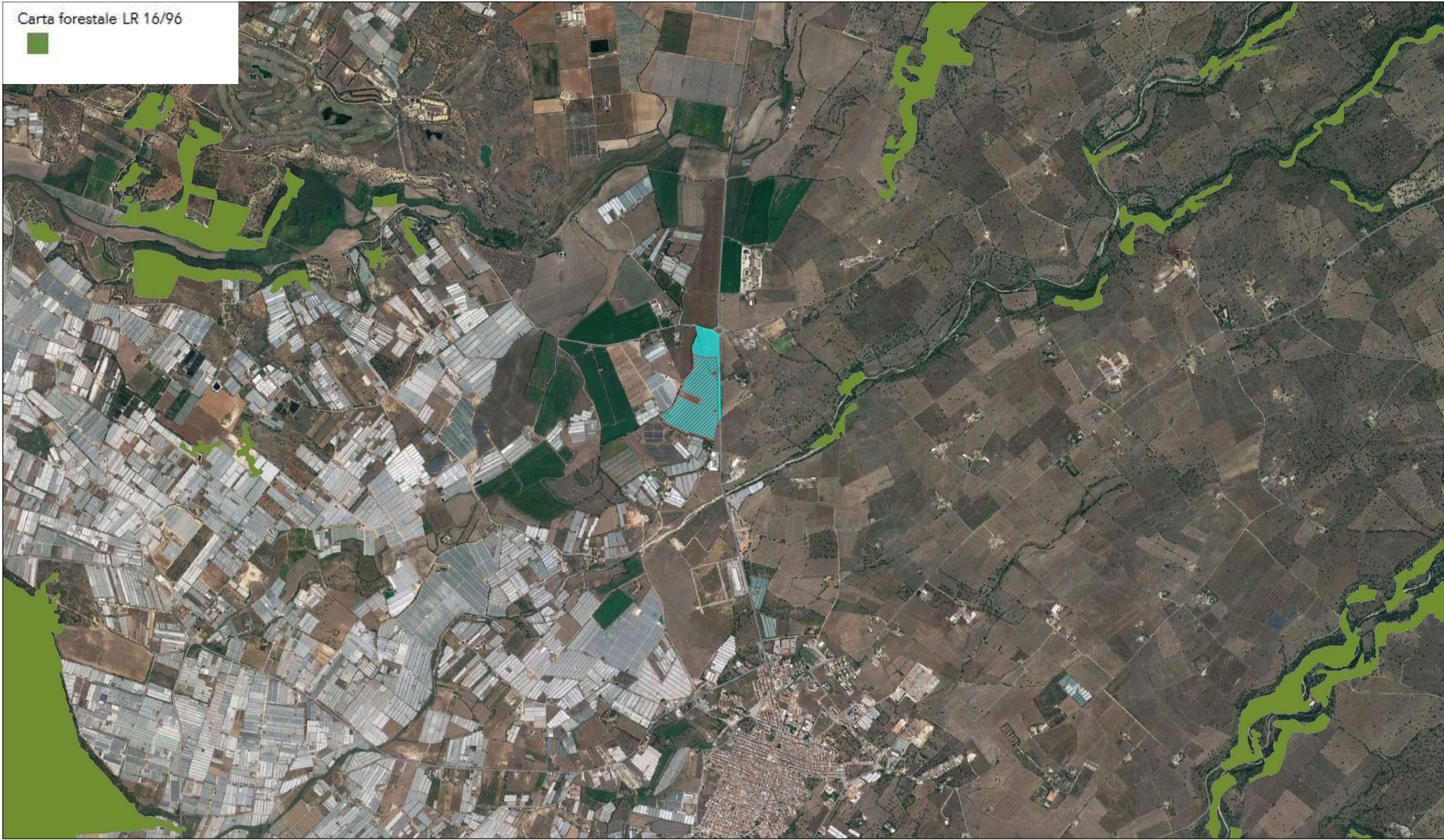
STRALCIO CARTA FORESTALE L.R. 16/96 SCALA 1:25.000