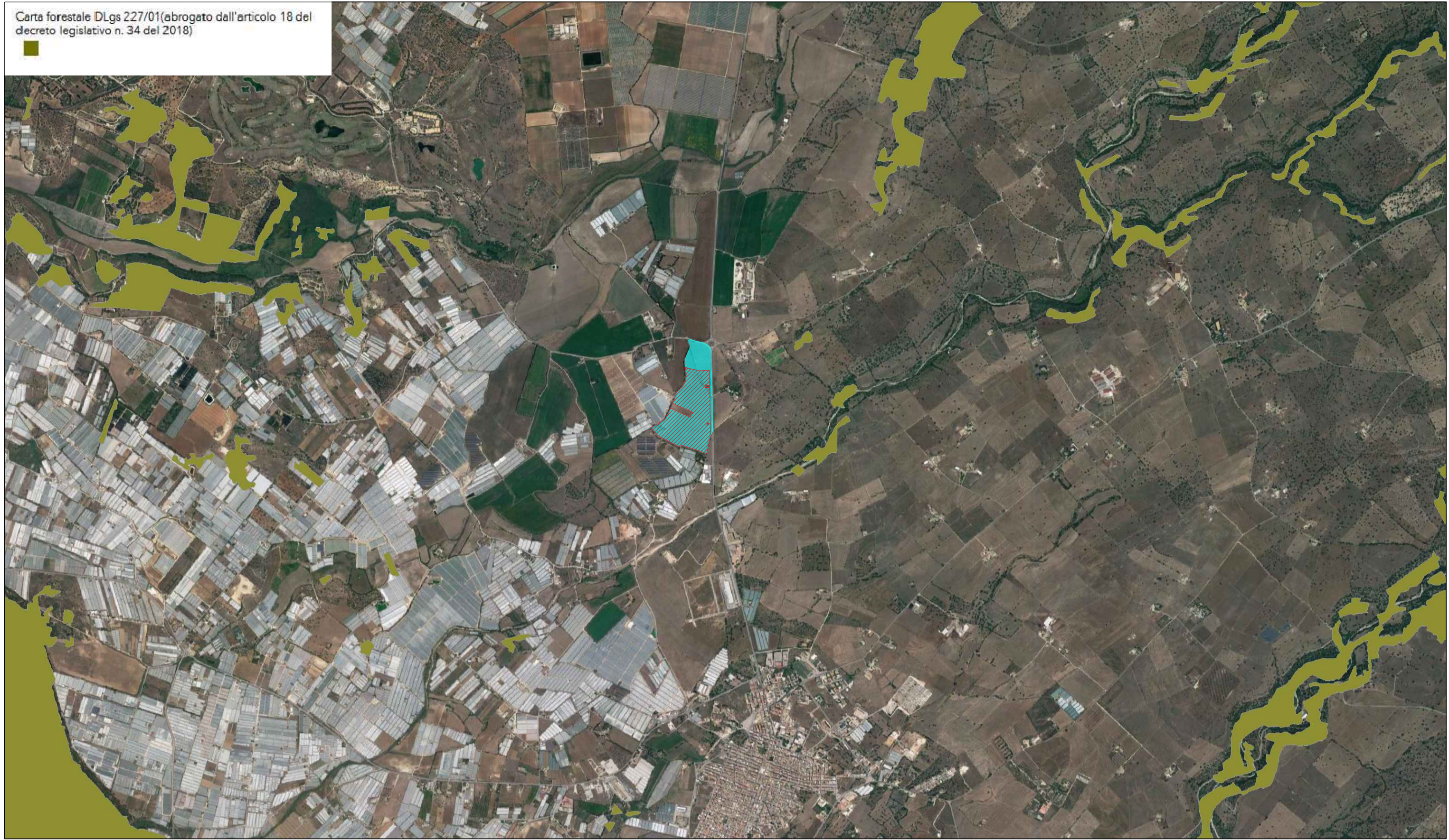
STRALCIO CARTA FORESTALE D. LGS. 227/01 SCALA 1:25.000